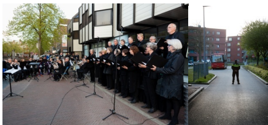
Brassband Almere & Schütz Ensemble