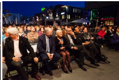
Een volle Grote Markt... De brug van herdenken naar vieren