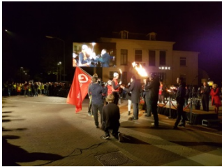
Overdracht Bevrijdingsvuur in Wageningen