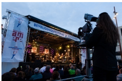
Grote Markt 2016