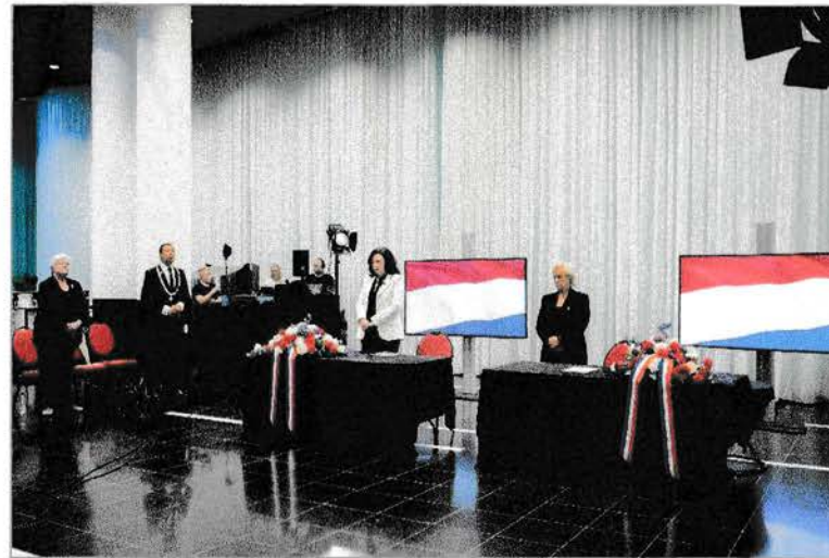
'In Almere zijn we 2 minuten stil'